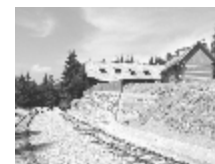
Expozícia OLŽ stanica Tanečník